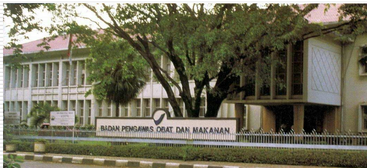
Badan Pengawas Obat dan makanan RI